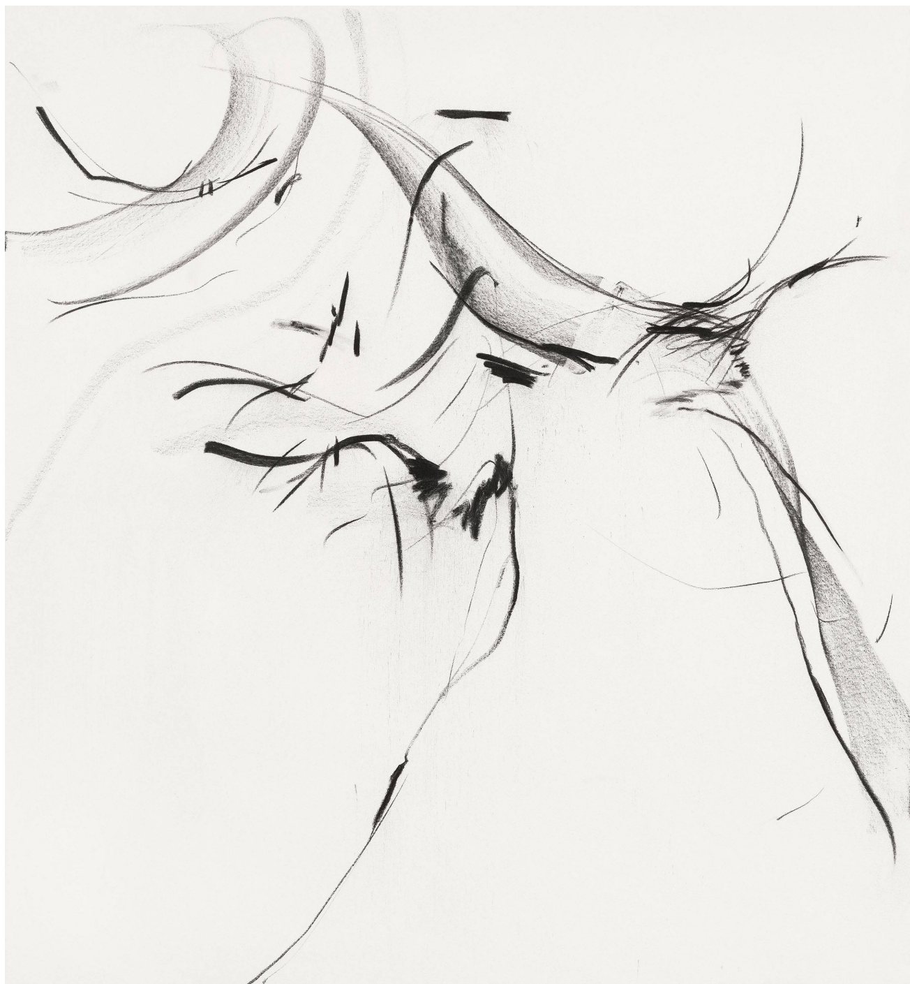
《良宵引之三》，布面木炭，135 × 125 cm，2023