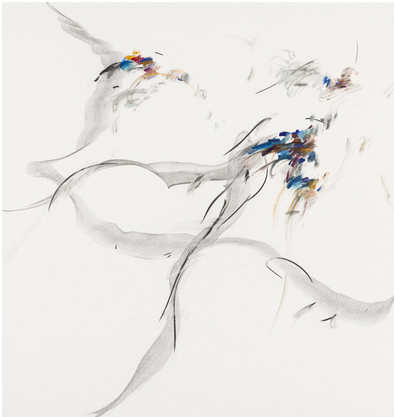
《仙翁操之三》，布面油画笔，木炭，200 × 190 cm，2023

脉络，通过对生命最微弱的沙沙声给予深刻的关注，为在生命张力之中无限的生长、延展、伸长、悬垂和存续予以契机。