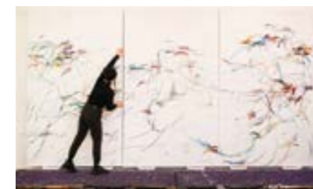
王茜瑶在工作中。