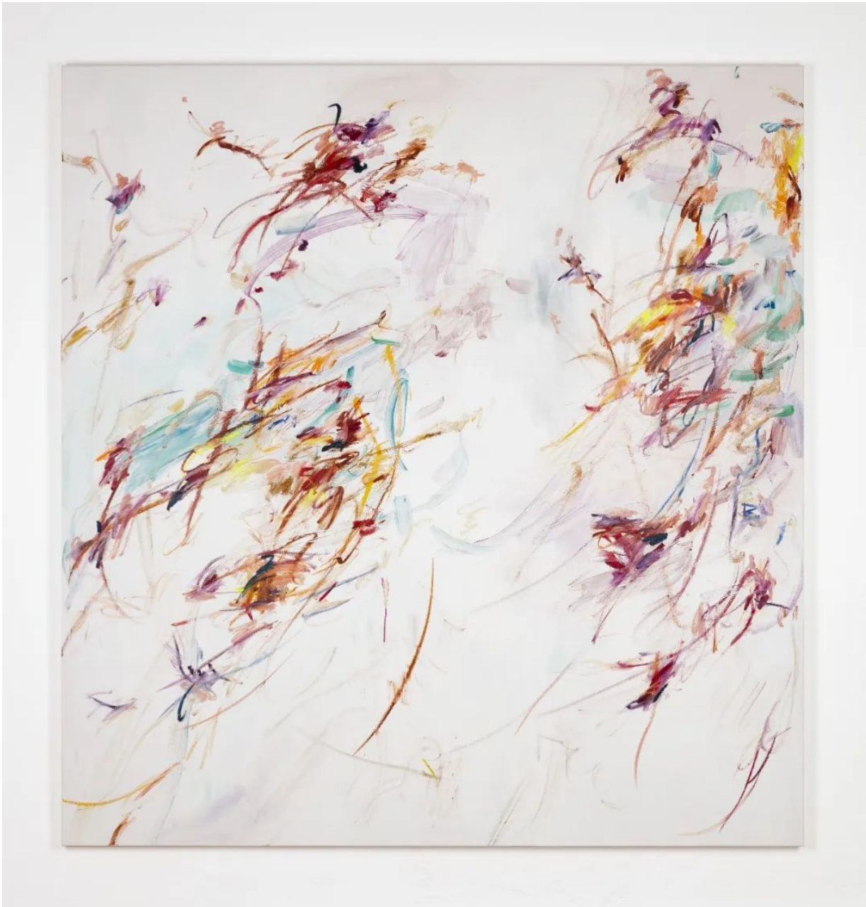
王茜瑶， 《Carve the time in the palm of your hand no. 1》 布面丙烯，油画棒， 200 x 190 cm，2022年